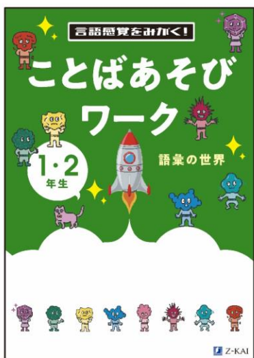
※表紙デザインは変更する場合があります