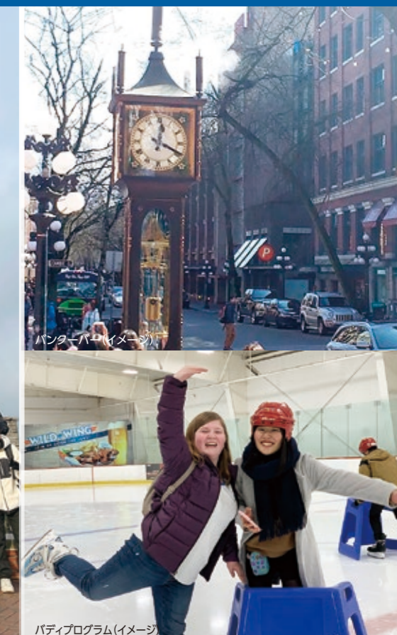
パティプログラム（イメージ）