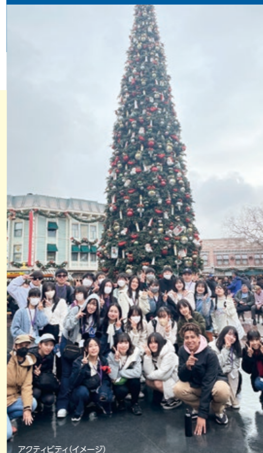
アクティビティ（イメージ）