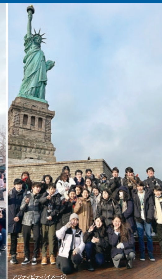
アクティビティ（イメージ）