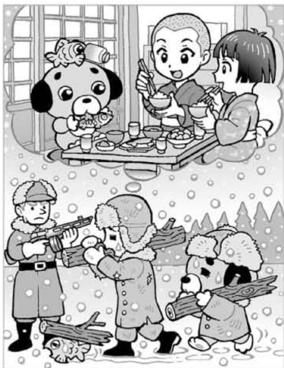
イラスト・瑞木匠

日本と中国との戦いは中国本土で行われたため、終戦直後の中国国内には多数の日本の軍人がいました。ただ、表を見ると中国東北部には軍人をはるかに上回る数の一般市民がいたこと