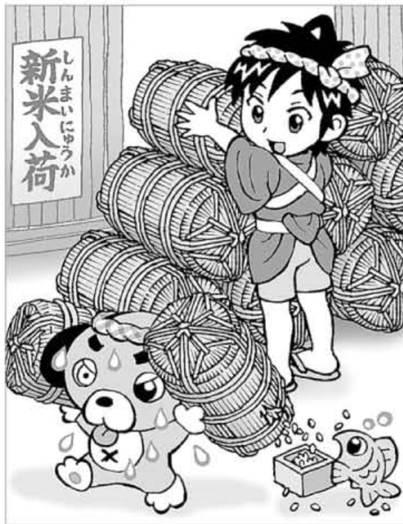
イラスト・瑞木匠

上の式の( )の部分、「最上段の個数+最下段の個数」が奇数か偶数かを考えてみます。なお、偶数とは2で割り切れる数のことです。まず、段数が2のときは、最上段と最下段は