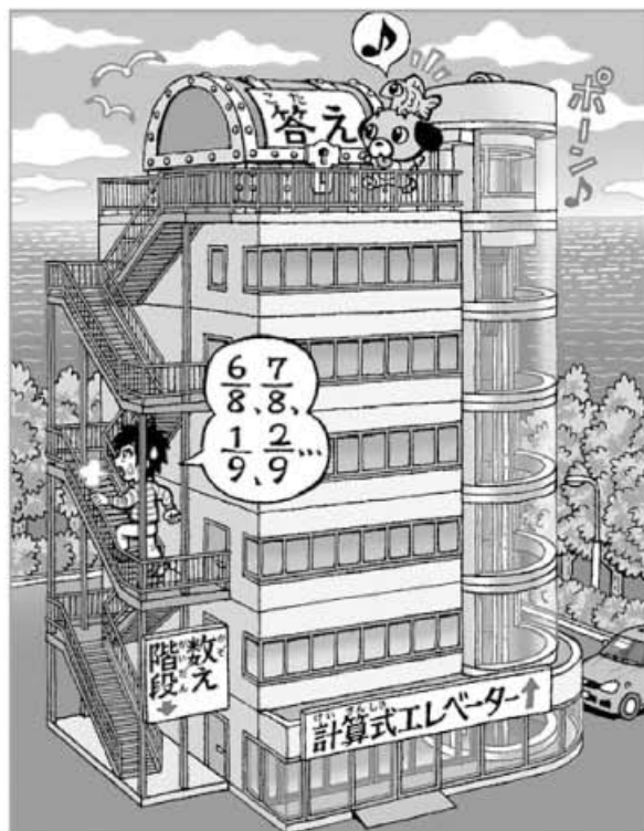
イラスト・瑞木匠

表より、分母が6以下の分数は15個ありますね。つまり、15番目の分数は、分母が6の最後の分数なので、(1)の答えは \frac{5}{6} です。