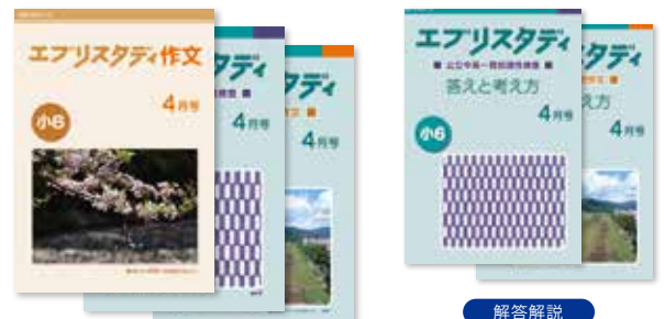
解答解説 エブリスタディ 答えと考え方