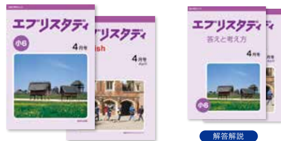
解答解説 エブリスタディ 答えと考え方

基本から応用まで段階的に学べるテキストです。わかりやすい解説と豊富な図解で、難しい単元もしっかり理解できます。