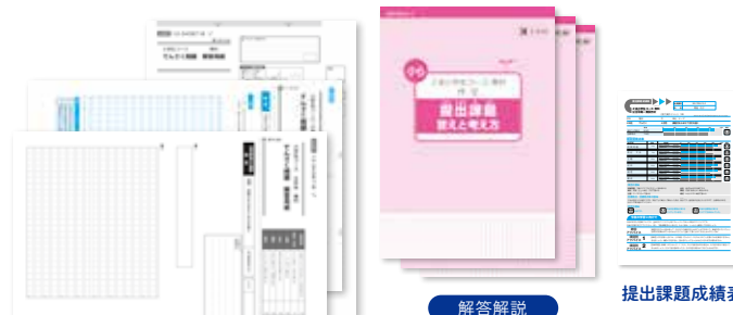
解答解説 提出課題 答えと考え方

1カ月のまとめとして取り組む提出課題。その分野に熟達した専門の指導者が添削します。