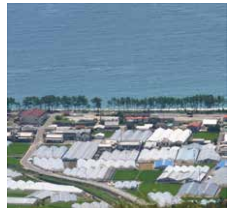
高知県のビニールハウス